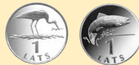
Viena lata monēta ar stārķi. Viena lata monēta ar lasi.